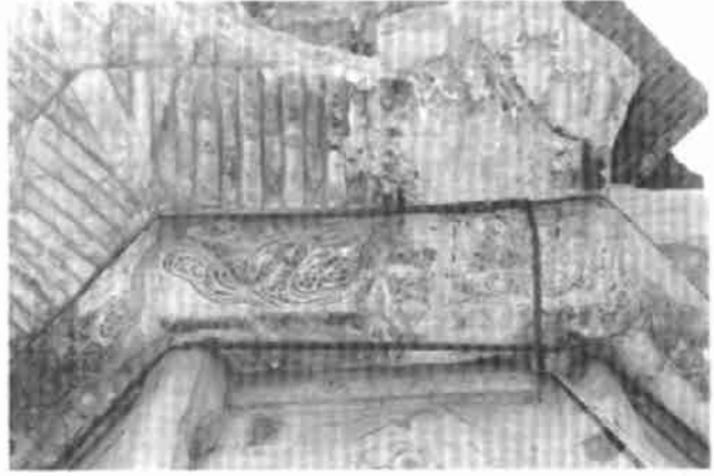
图版 37 飞天 南京栖霞寺舍利塔