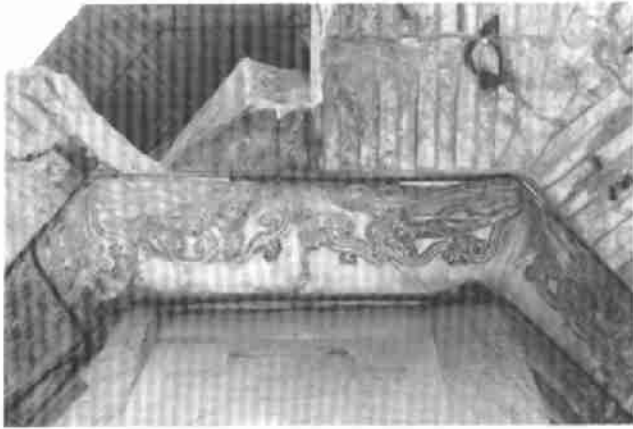
图版 36 飞天 南京栖霞寺舍利塔