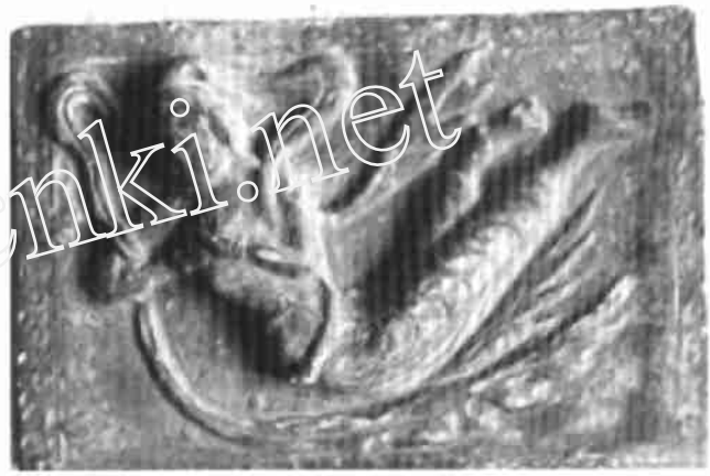
图版 39 飞天 南京陆先生所藏飞天青砖